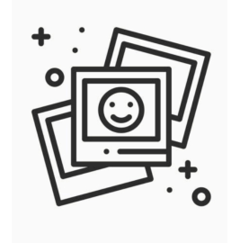
Foto Ihres Kindes

zur Betreuung nach dem Unterricht bei den MENCKEFÜCHSEN an.